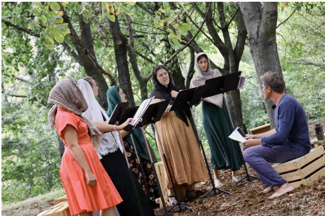
PREMIÈRES RECHERCHES AU PARC DÉPARTEMENTAL JEAN-MOULIN -LES GUILANDS ÉTÉ 2019